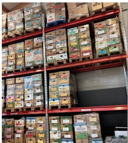
På Hela Människans lager i Tullinge ligger secondhandvaror packade i banankartonger i väntan på transport till butikerna.